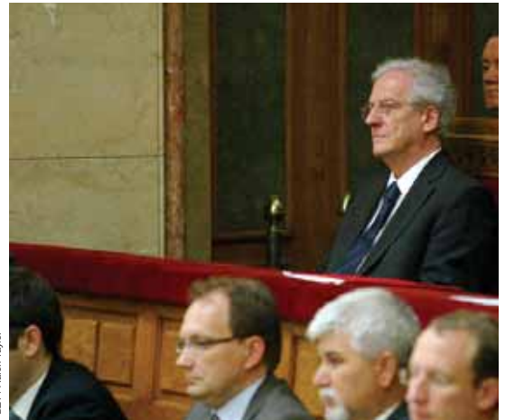
Auslaufmodell kritischer und kompetenter Staatspräsident: László Sólyom am vergangenen Dienstag im Parlament.

Aus dem Blickwinkel der politischen Mächtigen sind diese Schachzüge durchaus nachvollziehbar. Fraglich ist allerdings, ob die Position des Staatspräsidenten als wichtiges Glied bei der demokratischen Gewaltenteilung