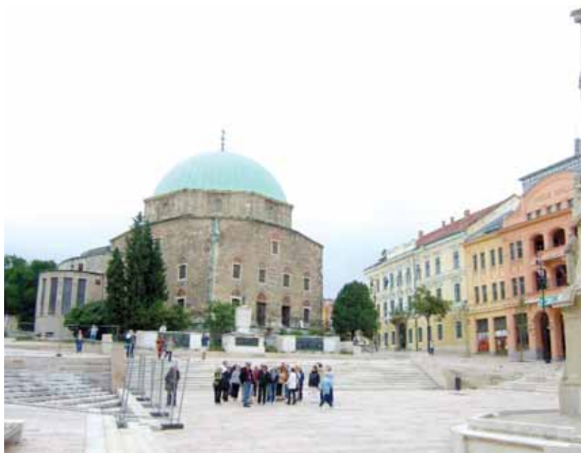
Der Széchenyi tér wurde für das Kulturhauptstadtjahr sichtlich aufgeputzt.