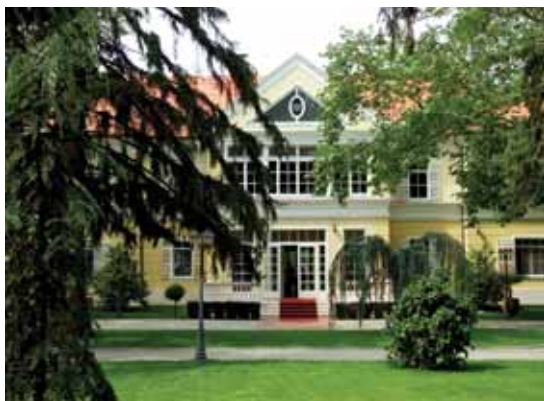
Chateau Viz: Fassade des besten Restaurants Ungarns.