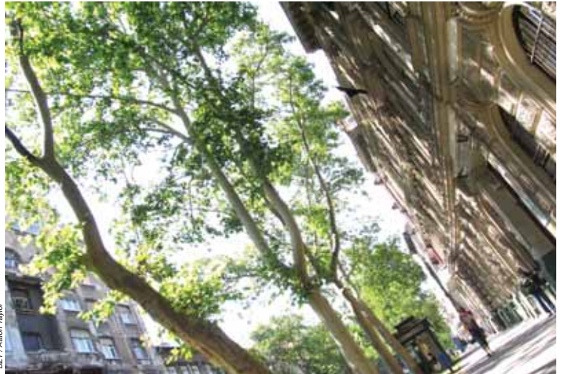
Die Platanen in der Budapester Nagymező utca.

Das Thema ist schon seit langer Zeit auf dem Tisch. Die Geschichte erreichte zuletzt im März 2009 die Aufmerksamkeit der Medien, als Aktivisten gegen die Abholzung von 18 Platanen in der Nagymező utca protestiert hatten. Damals konnten die Demonstranten die Bäume schüt-