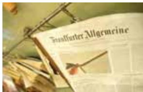
Die FAZ sucht man ab jetzt vergeblich.