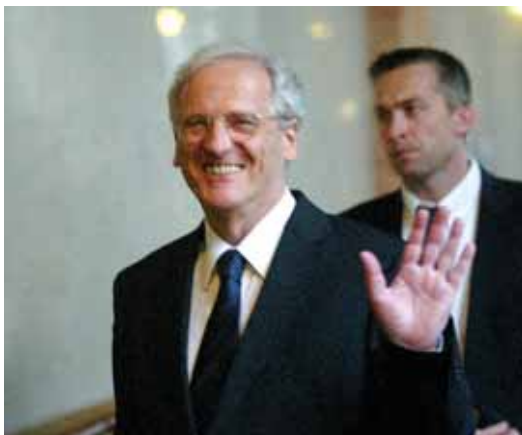
Abchied nach fünf Jahren: László Sólyom wurde nicht nominiert.

Angesichts der jahrelangen Nähe des Fidesz zu Sólyom wurde von vielen Bürgern erwartet, dass die Wiederwahl des Staatsoberhauptes wahrscheinlich ist. Doch sie irrten sich. Mit dem erdrutschartigen Wahlsieg im vergangenen April war die Begeisterung des Fidesz für László Sólyom wie im Nu verflogen. Was auf den ersten Blick als unverständlich anmutet, ist bei näherer Betrachtung aber