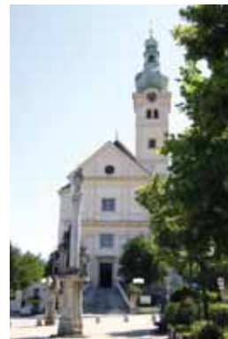
„Musik und Macht beim Lockenhauser Kammermusikfestival.“

Weitere Informationen zum Festival: www.kammermusikfest.at INES GRUBER