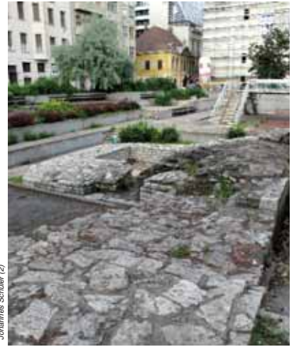
Die Innerstädtische Pfarrkirche musste im Laufe der Jahrtausende viele Bewährungsproben bestehen.

war sich der symbolischen Bedeutung dieser Kirche sehr wohl bewusst und dirigierte hier mehrmals eigene Werke und als Höhepunkt die Erstaufführung der „Missa Choralis“ im Jahr 1872.