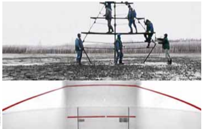
„Arbeit & Kraft“ von Anna Molska.

Ein Lichtblick folgt kurz darauf, in Form von bunten Malereien der Künstlerin