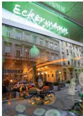
Seit Mittwoch sind die Lichter aus.