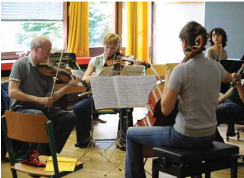
Eintauchen in einen „höchst spannenden musikalischen Gedanken- und Erfahrungsaustausch“.

Unter dem Motto „Musik und Macht – Musik als Macht“ findet vom 8. bis 18. Juli auf Burg Lockenhaus in der barocken Pfarrkirche und im alten Kloster das 29. Kammermusikfest statt.