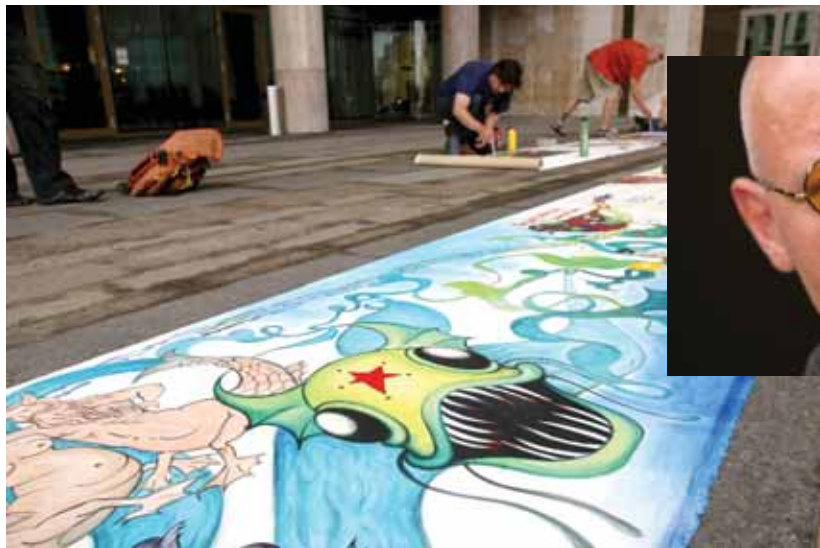
Monster aus dem Fluss zieren die 30 Meter lange Donaurolle.

Bevor dann allerdings die eigentliche Reise Ende Mai in Regensburg startete, trafen sich die teilnehmenden Künstler in Stuttgart, um den künstlerischen Aspekt der Tour