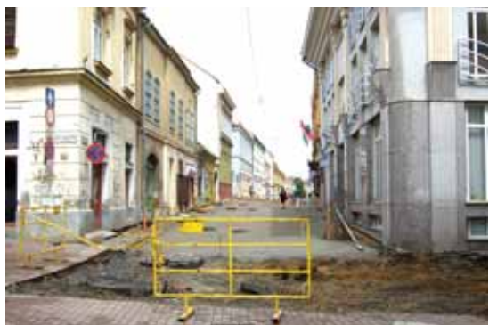
Immer noch Baustellen.