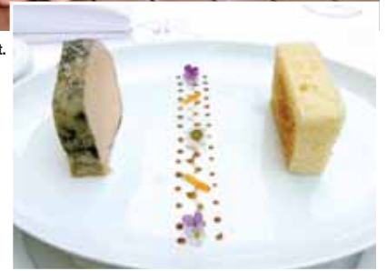
Liebe zum Detail: Gänseleber mit Gänseblümchen.

Sein Knowhow und seine Erfahrungen teilt er aber nicht nur mit seinen Kollegen. Als weiteres Element der angestrebten Kontinuität werden weiterhin Kochkurse angeboten, die bereits ab einer Person belegt werden können. „Diese Kurse machen mir Spaß. Gerne beant-